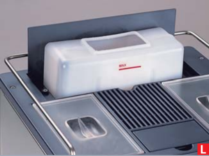
tanica da 5 lt o attacco diretto 5 lt water tank or direct water connection