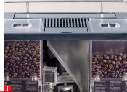
macinino singolo o doppio single or double grinder