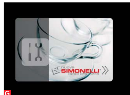
smart card smart card