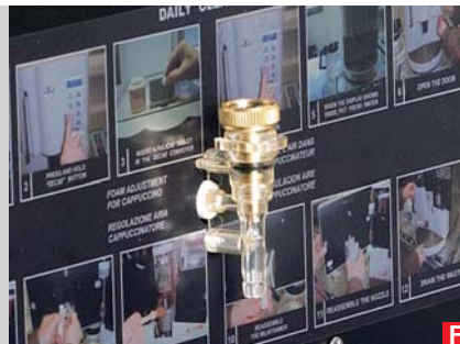
regolatore densità latte milk foam-density adjustment