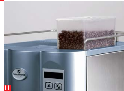
extra-sylos bean hopper extension