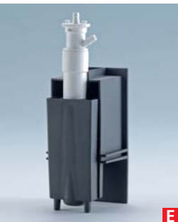
cappuccinatore incorporato built-in milk-foamer